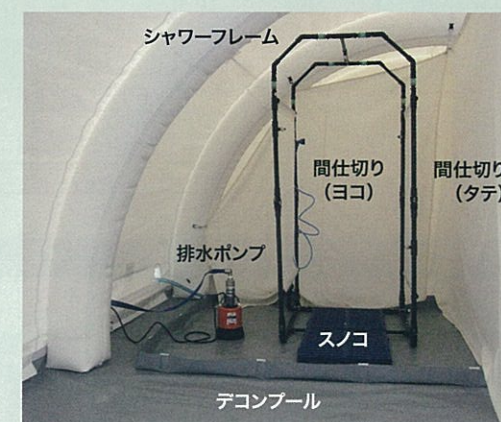
▲内観 (シャワースペース)