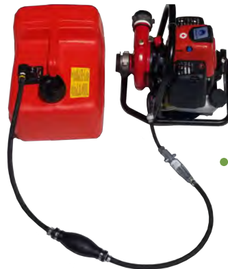
● 燃料給油キット接続例 (連続5時間以上の長時間運転が可能)